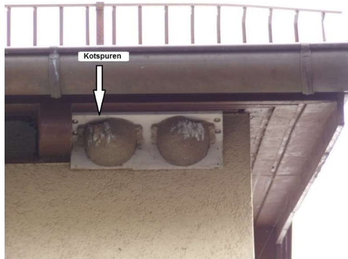
Foto: Doppelnisthilfe Schwegler; an den Kotspuren ist zu sehen, dass die Nester sofort angenommen wurden.

Insgesamt wurden durch die Betreuung unseres Schwalbenexperten U.V. in den letzten 6 Jahren über 350 Nisthilfen in der LHH und außerhalb der LHH angebracht, davon sind bis jetzt über 80% belegt. In den meisten Fällen handelt es sich um Ersatzmaßnahmen. Ein Teil der Nisthilfen wurde direkt vom Veranlasser/Verursacher beschafft oder gegen Rechnung vom BUND gekauft. In Notsituationen haben wir die Nisthilfen zur Verfügung gestellt.