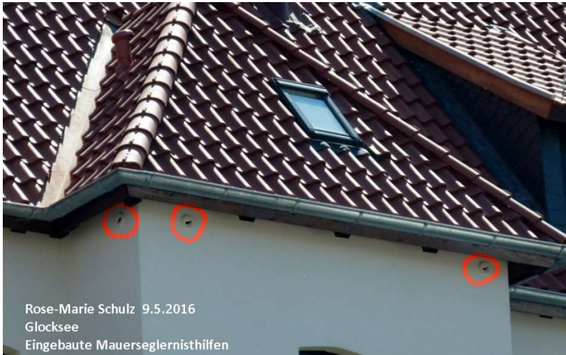
Glocksee: Eingebaute Mauersegelnisthilfen

Rose-Marie Schulz 9.5.2016 Glocksee Eingebaute Mauersegelnisthilfen